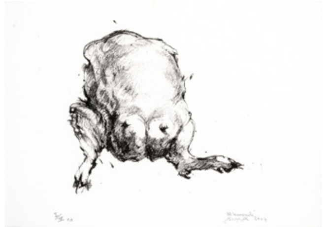
Litho II Lithography on paper 23 x 31 cm 1/3 2004