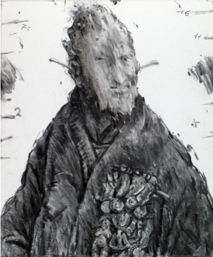
JoJo The Chemist Charcoal on canvas 55 x 46 cm 2018