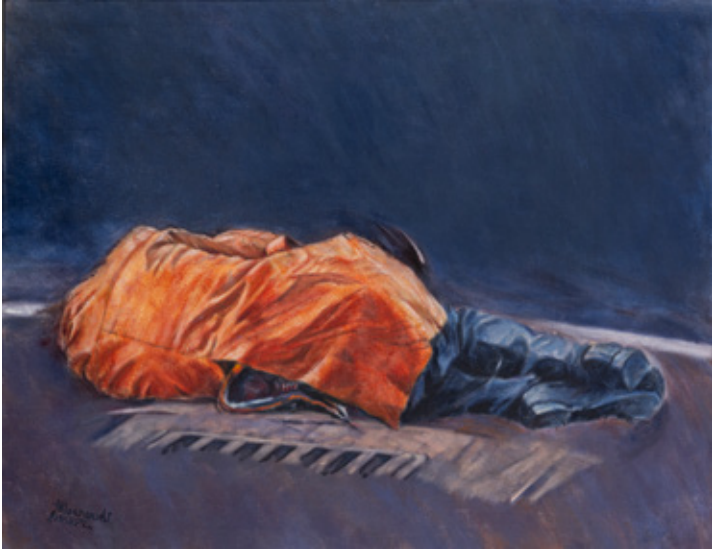
Relaxation Acrylic on canvas 85 x 109 cm 1988