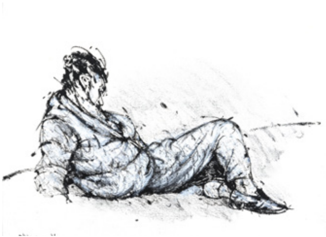
Sketch III Acrylic and Ink on paper 23 x 31 cm 1990 - 1995