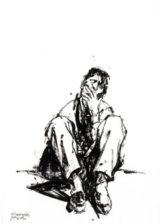
Sketch I Ink on paper 31 x 23 cm 1990 - 1995