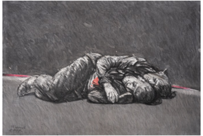
Good Times Charcoal and Pastel on canvas 70 x 100 cm 1989