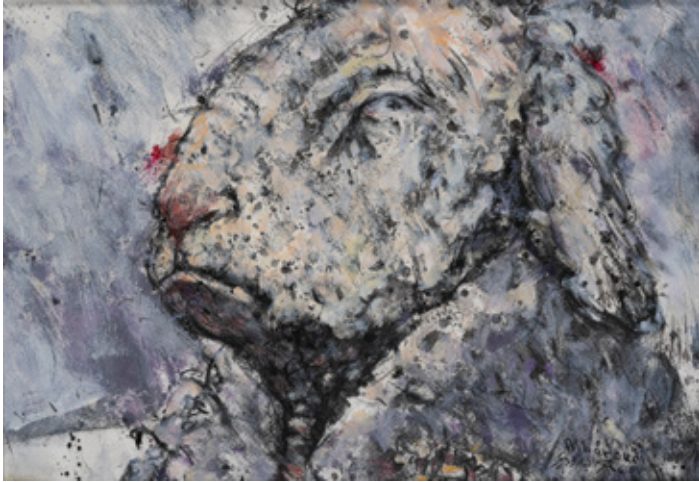
Beautiful Look Charcoal and Acrylic on paper 29.7 x 42 cm 2009