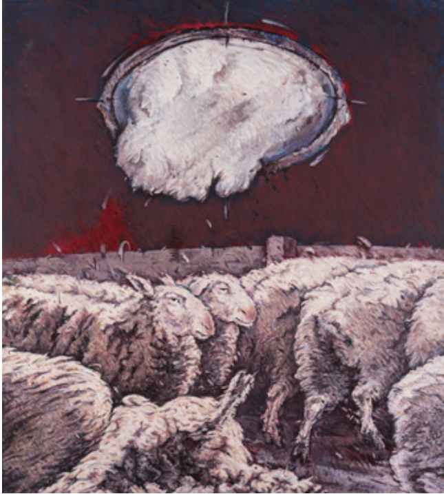
Chirurgical Strike Acrylic on canvas 150 x 135 cm 2021