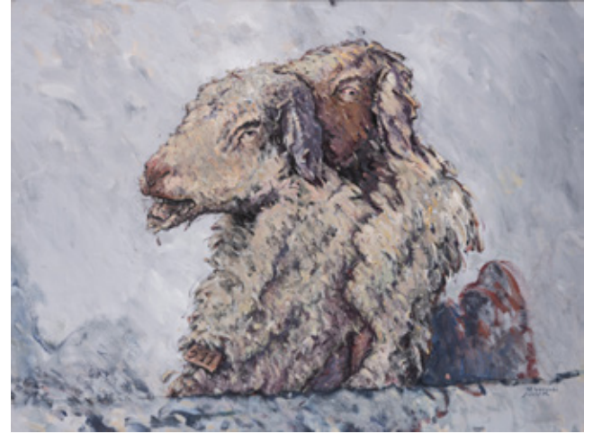
Brainwashing Acrylic on canvas 90 x 120 cm 2010