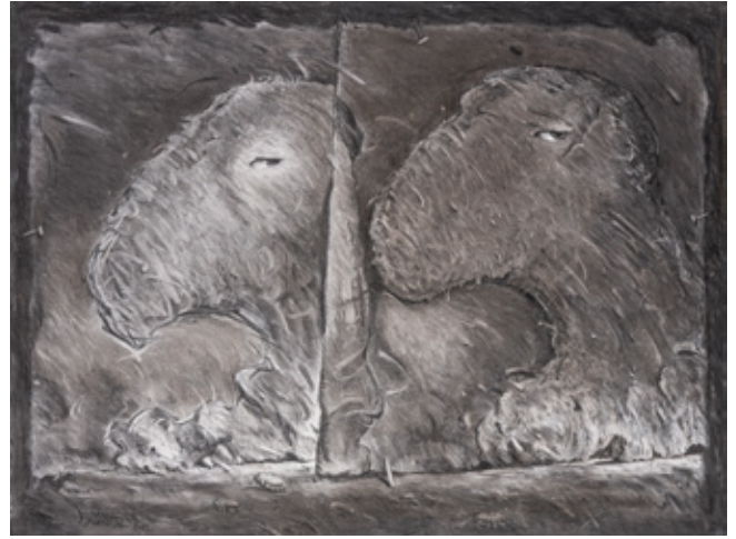
Always Listening Charcoal on canvas 120 x 160 cm 2011