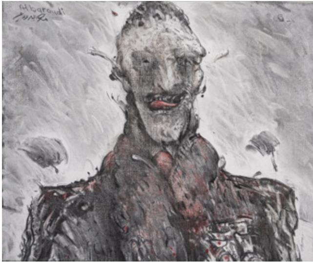
The Tie I Charcoal and Pastel on canvas 46 x 55 cm 2023