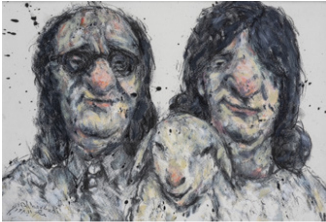
Family II Charcoal and Acrylic on paper 29.7 x 42 cm 2009