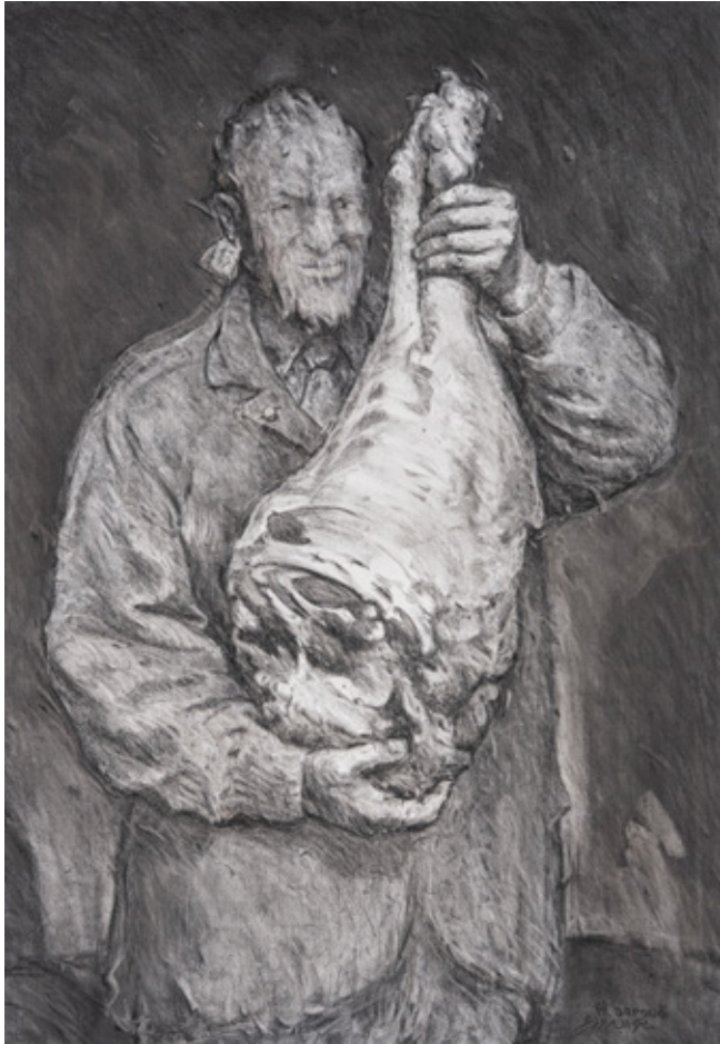
The Spring Charcoal on canvas 100 x 70 cm 2024