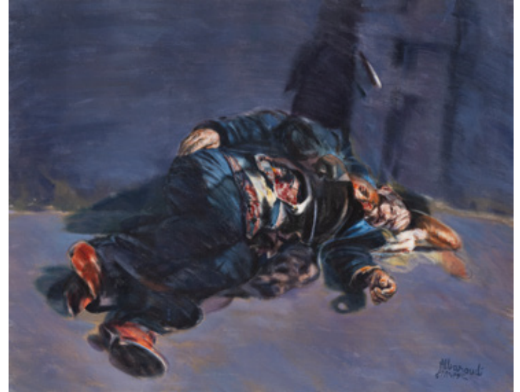
Being Relaxed Acrylic on canvas 85 x 109 cm 1989