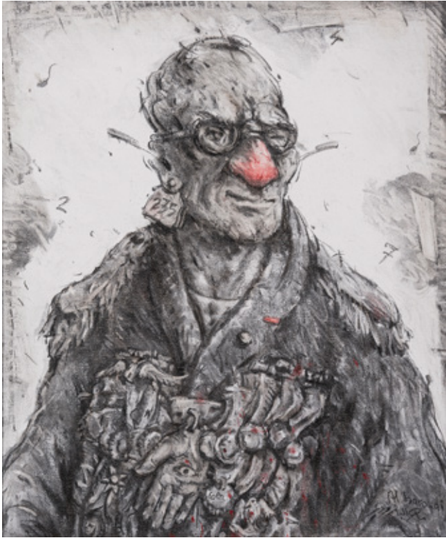
Francine 235 Charcoal and Pastel on canvas 55 x 46 cm 2019