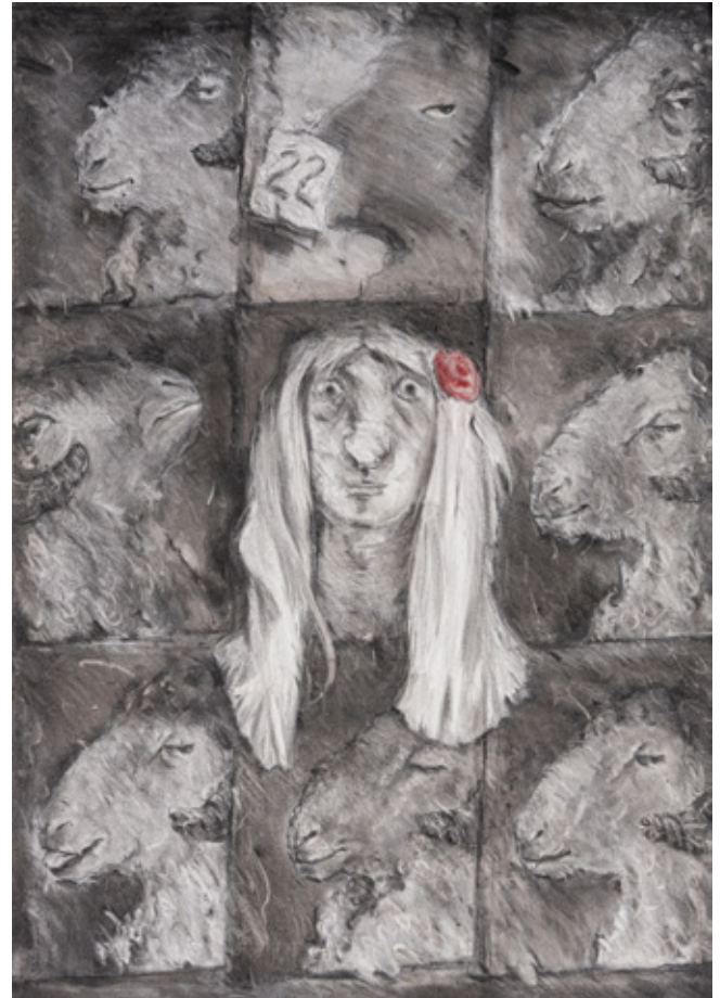
Masks II Charcoal on canvas 100 x 70 cm 2009