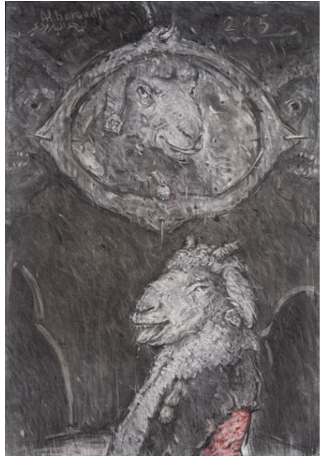
Happy Charcoal and Pastel on canvas 100 x 70 cm 2022