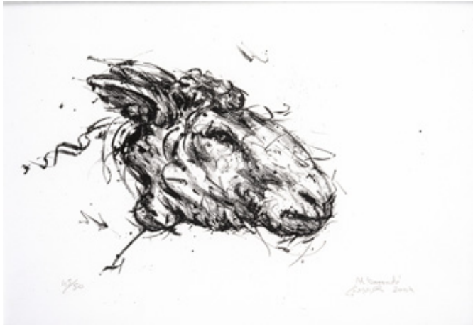
Litho I Lithography on paper 23 x 31 cm 45/50 2004