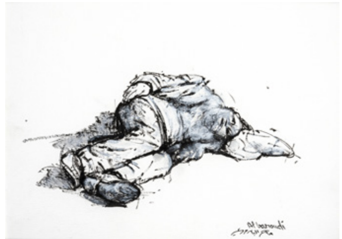
Sketch II Acrylic and Ink on paper 23 x 31 cm 1990 - 1995