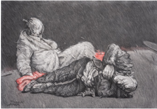
Company Charcoal and Pastel on canvas 70 x 100 cm 1994