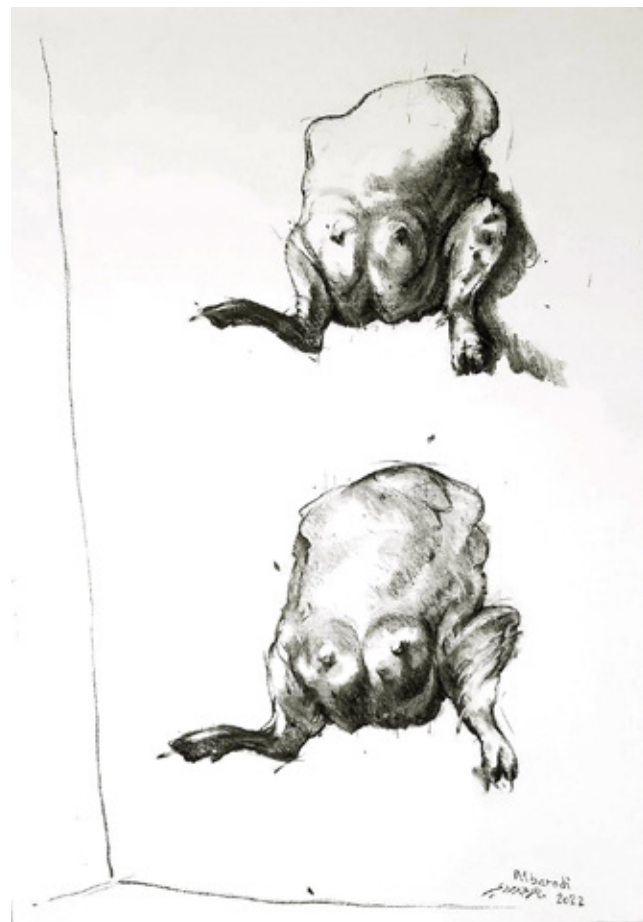
The Last Dance Charcoal on canvas 100 x 70 cm 2022