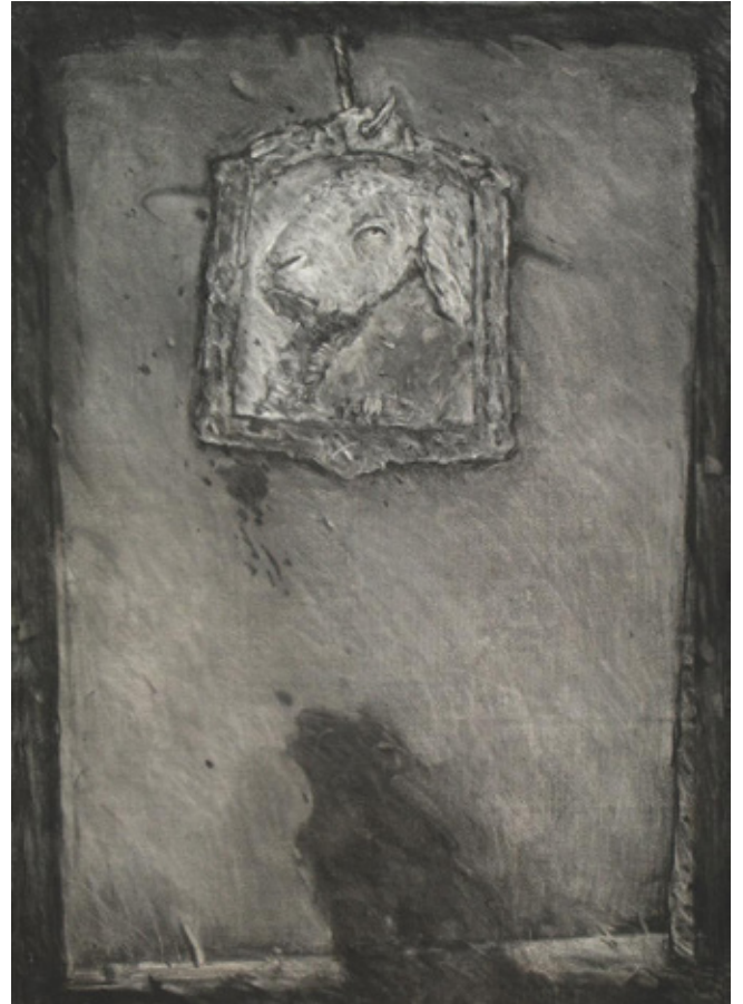
The Shadow Charcoal on canvas 100 x 70 cm 2009