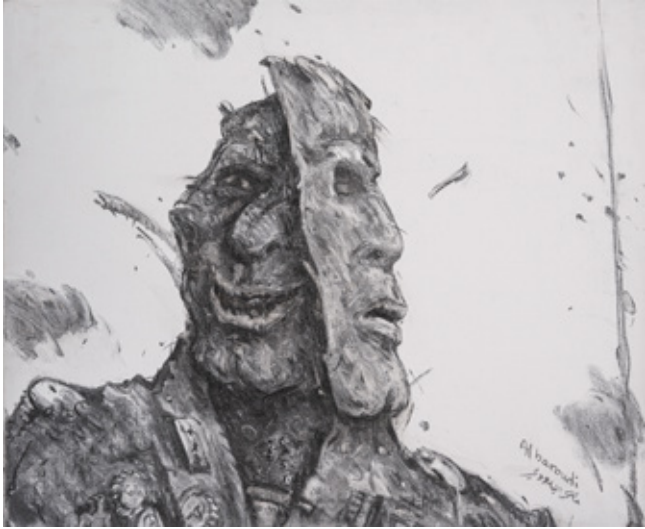
True or False Charcoal on canvas 46 x 55 cm 2018