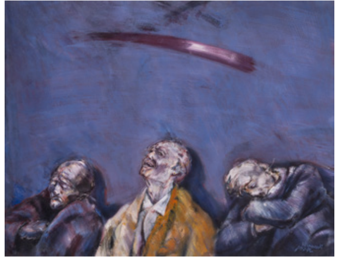
It Is 25 O'clock Acrylic on canvas 85 x 109 cm 1989