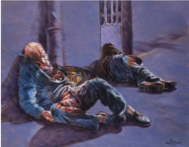
Two Beings Acrylic on canvas 85 x 109 cm 1989