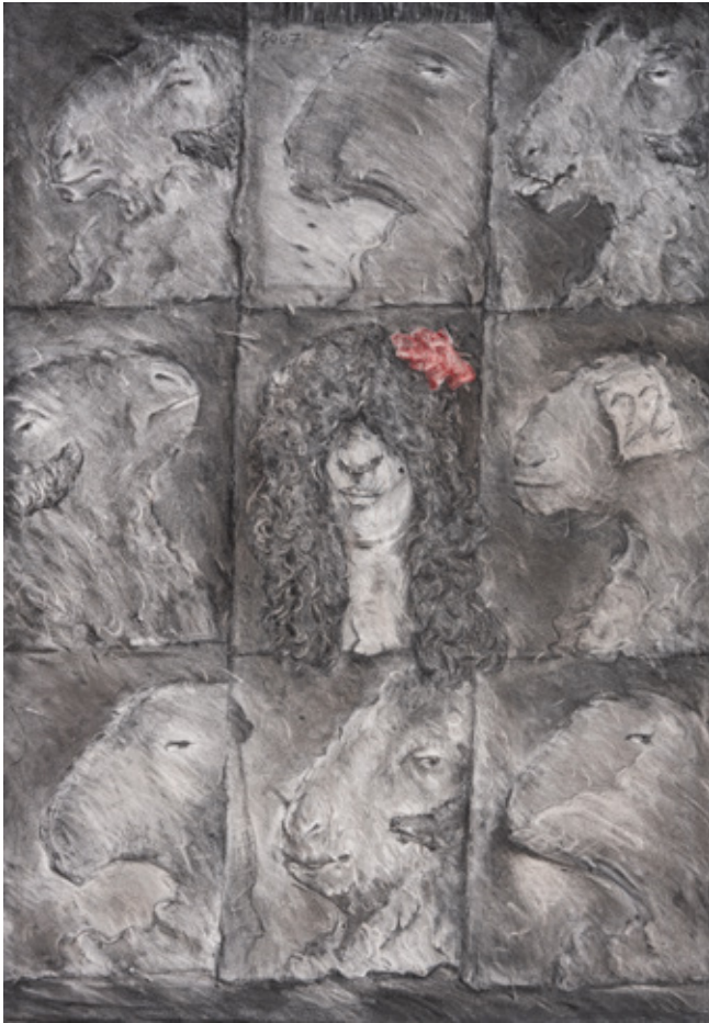
Masks I Charcoal on canvas 100 x 70 cm 2009