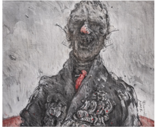
The Tie II Charcoal and Pastel on canvas 46 x 55 cm 2023