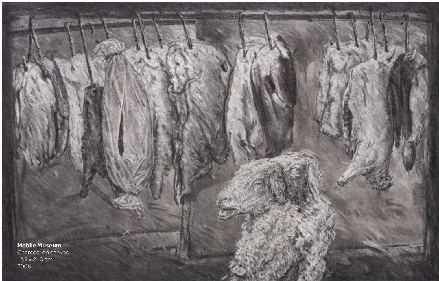
Mobile Museum Charcoal on canvas 135 x 210 cm 2006