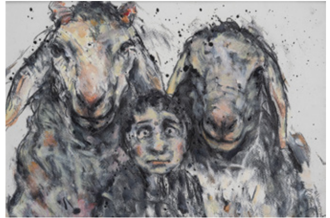
Family I Charcoal and Acrylic on paper 29.7 x 42 cm 2009