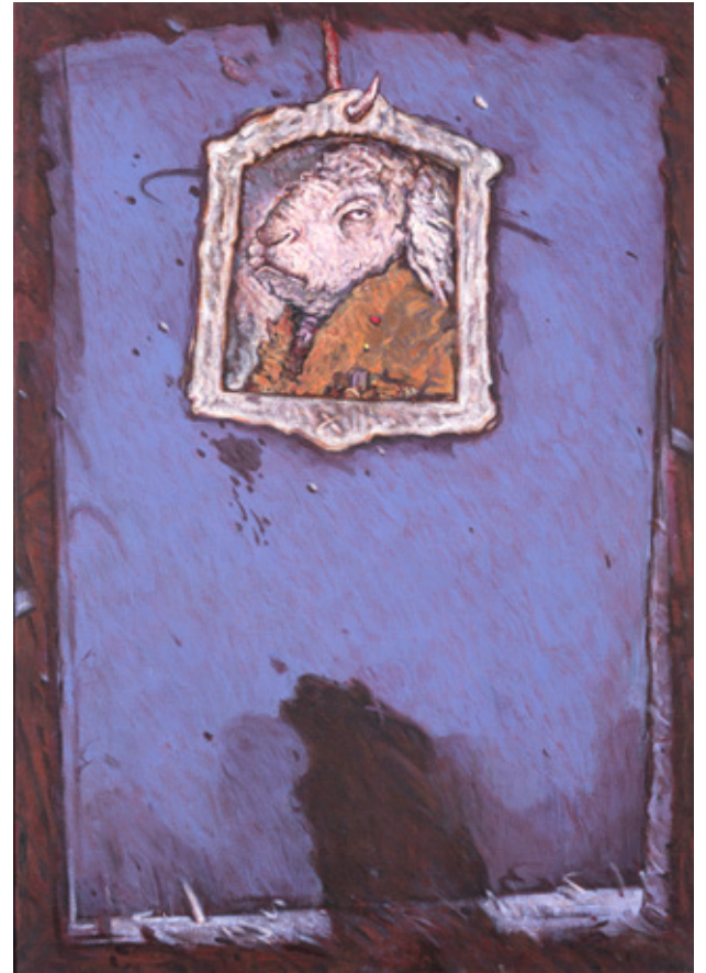
The Shadow Acrylic on canvas 100 x 70 cm 2021