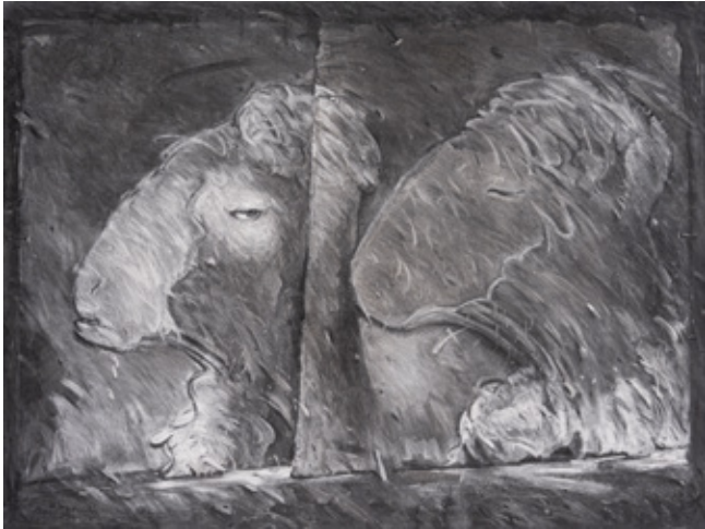
Listening To Charcoal on canvas 120 x 160 cm 2011