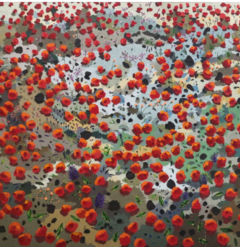
ARD XII Acrylic & Mixed mediums on canvas 300 x 150 cm 2023