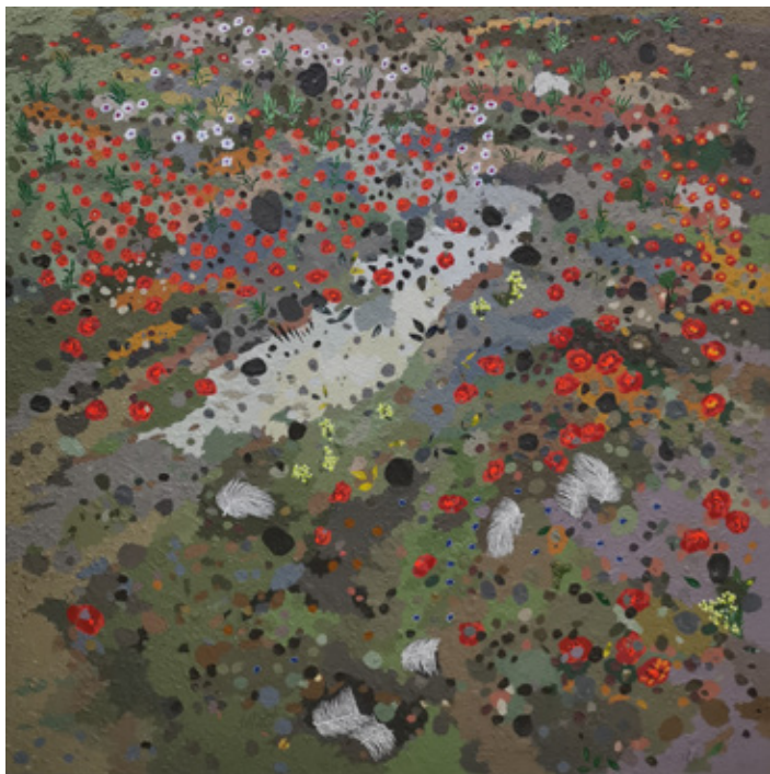
ARD VIII Acrylic & Mixed mediums on canvas 120 x 120 cm 2023