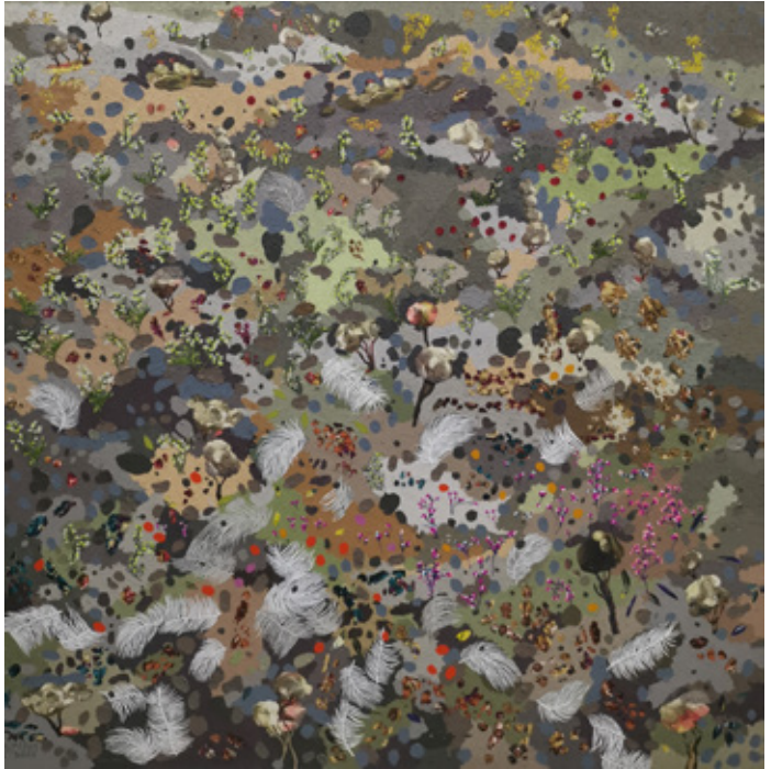
ARD IV Acrylic & Mixed mediums on canvas 120 x 120 cm 2023