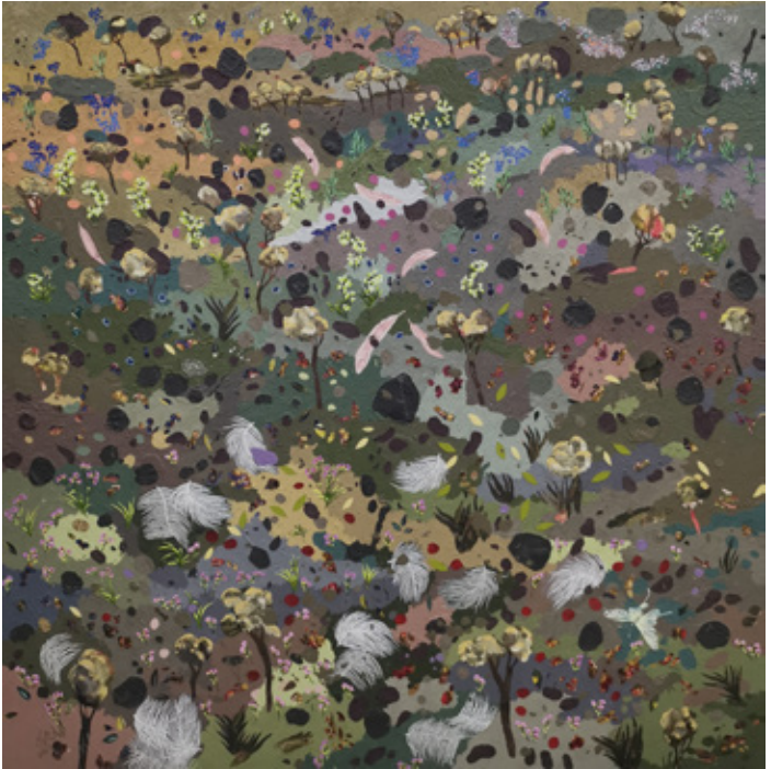
ARD III Acrylic & Mixed mediums on canvas 120 x 120 cm 2023