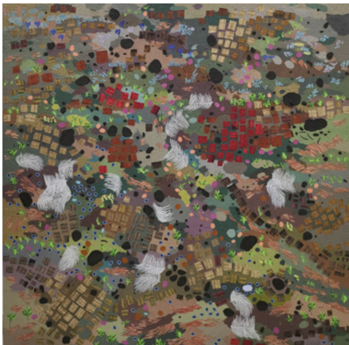
ARD V Acrylic & Mixed mediums on canvas 120 x 120 cm 2023