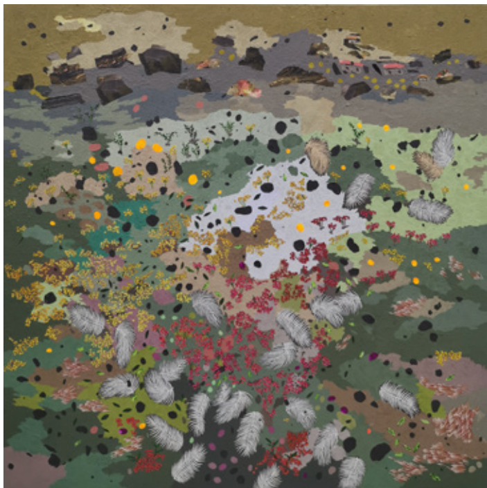
ARD VII Acrylic & Mixed mediums on canvas 120 x 120 cm 2023