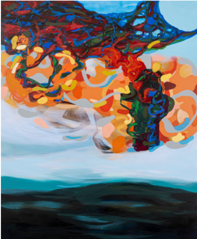
Bubbles Oil, Acrylics and oil pastels on canvas 180 x 145 cm 2022-2023