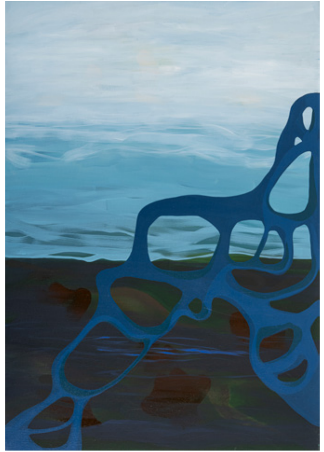
Desertion II Mixed media on Canvas 100 x 70 cm 2023