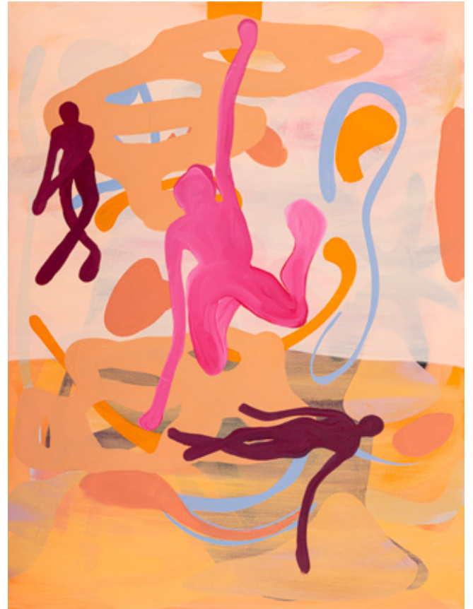
Great Sea of Sand (details) II Oil, Acrylics and oil pastels on canvas 80 x 60 cm 2023