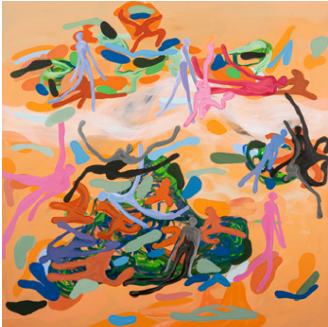
Great Sea of Sand I Oil, Acrylics and oil pastels on canvas 120 x 120 cm 2023