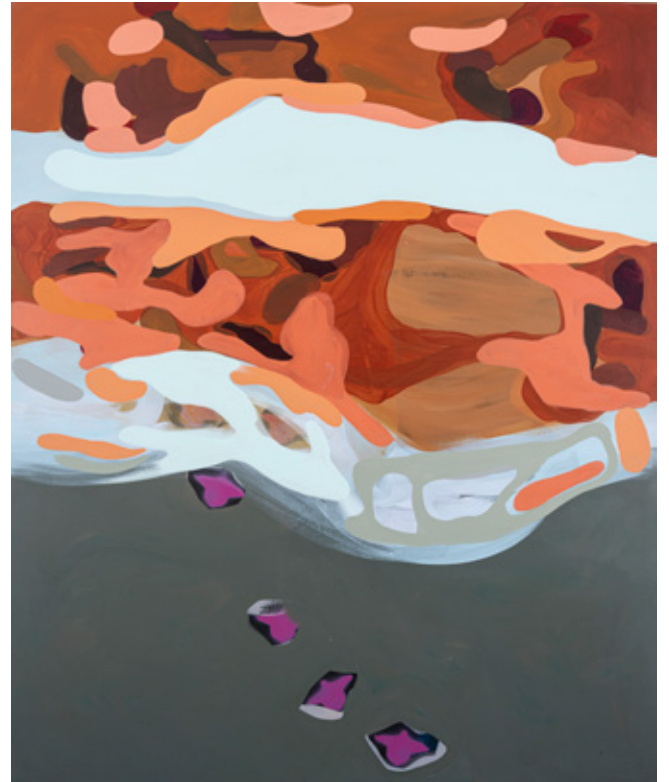
Pink Birds on the shoreline Oil, Acrylics and oil pastels on canvas 145 x 120 cm 2023