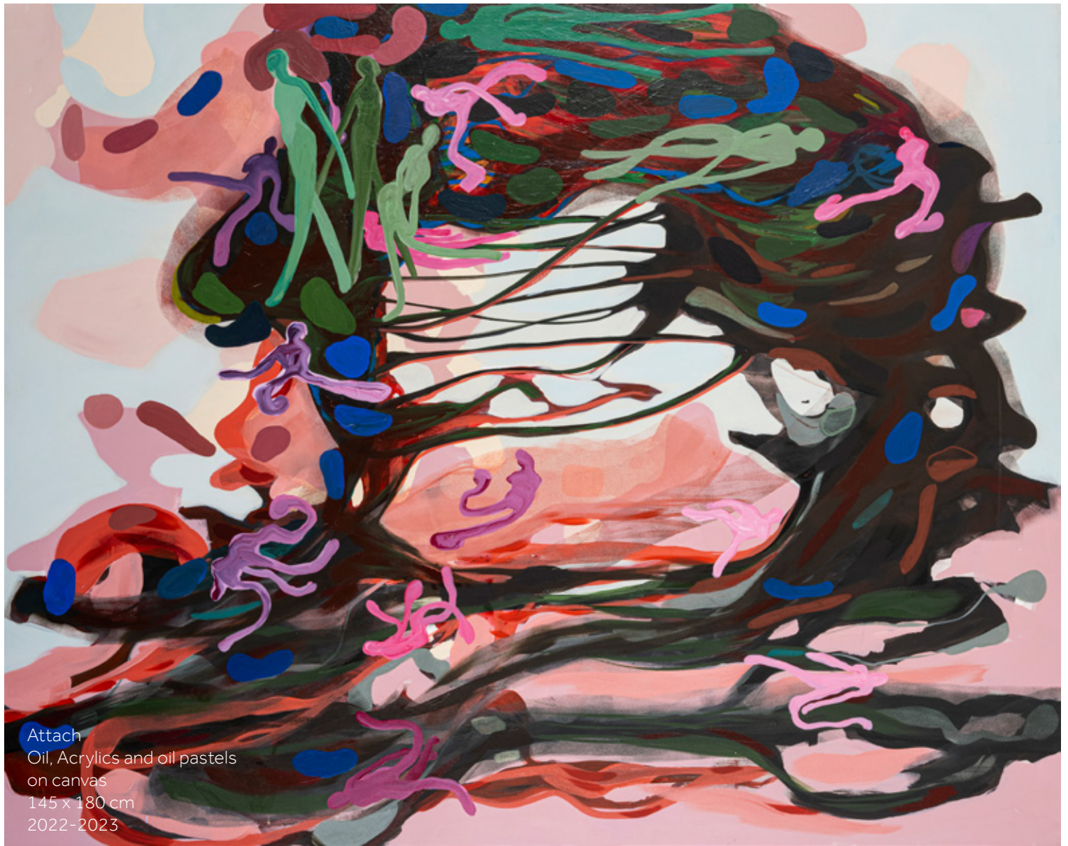
Attach Oil, Acrylics and oil pastels on canvas 145 x 180 cm 2022-2023