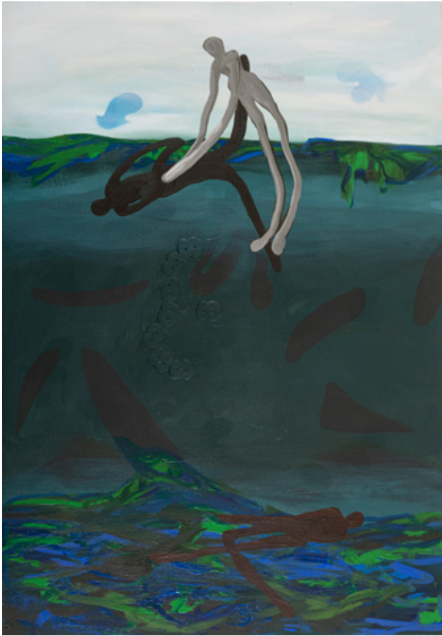
Encounter II Mixed media on Canvas 100 x 70 cm 2023