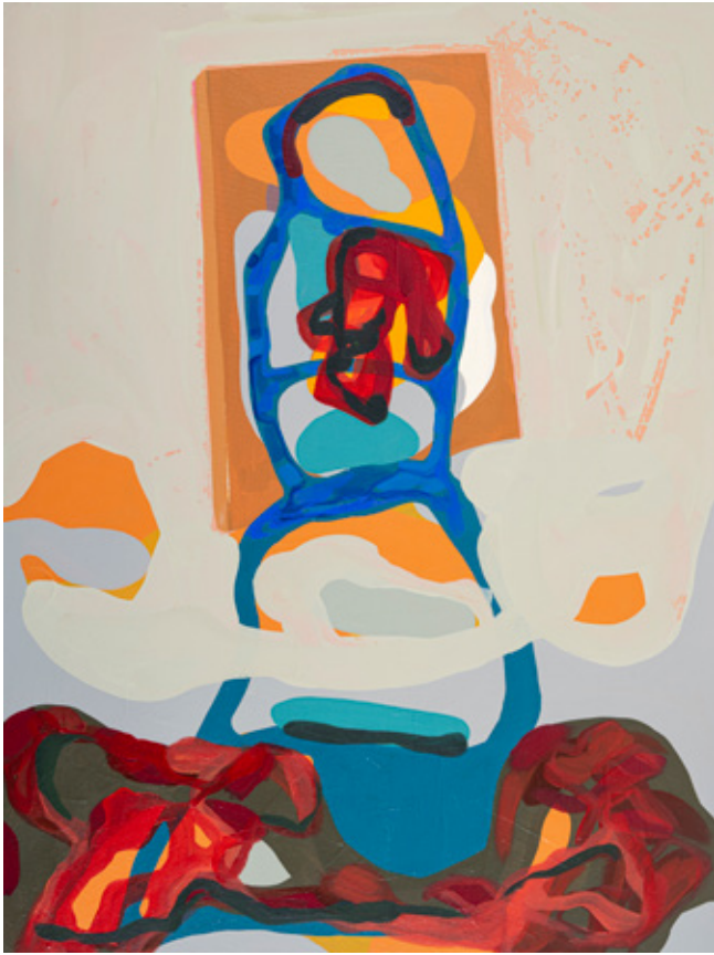
In action Oil, Acrylics and oil pastels on canvas 100 x 70 cm 2022-2023