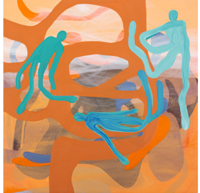
Great Sea of Sand (details) IV Oil, Acrylics and oil pastels on canvas 50 x 50 cm 2023