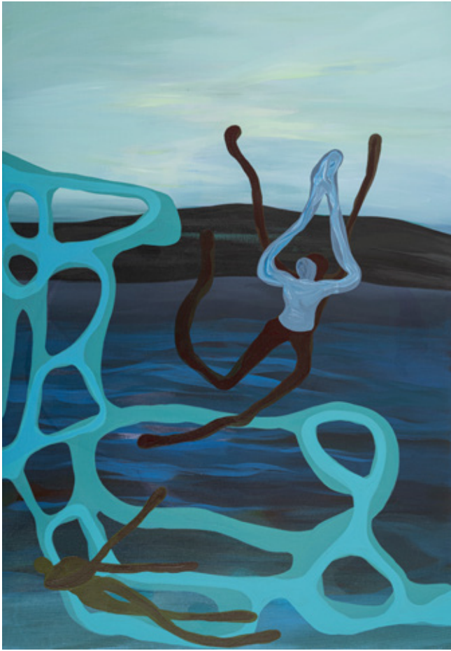
Encounter III Mixed media on Canvas 100 x 70 cm 2023