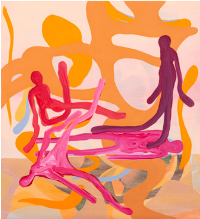
Great Sea of Sand (details) III Oil, Acrylics and oil pastels on canvas 55 x 50 cm 2023