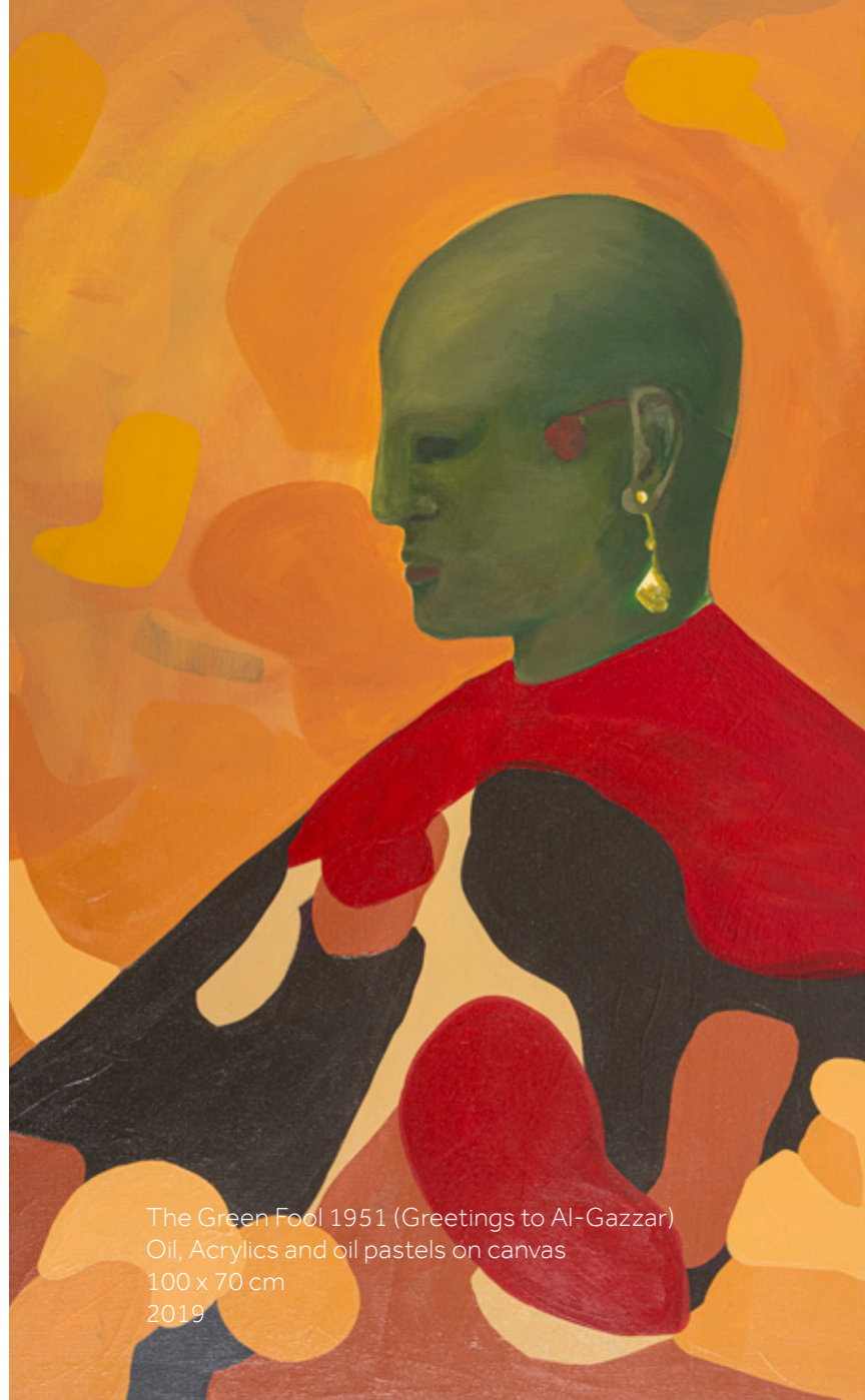
The Green Fool 1951 (Greetings to Al-Gazzar) Oil, Acrylics and oil pastels on canvas 100 x 70 cm 2019