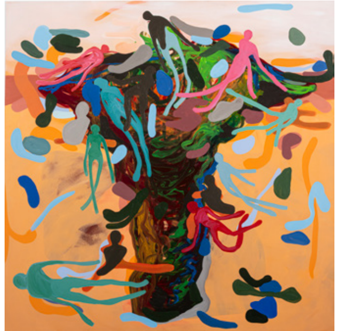
Great Sea of Sand II Oil, Acrylics and oil pastels on canvas 120 x 120 cm 2023