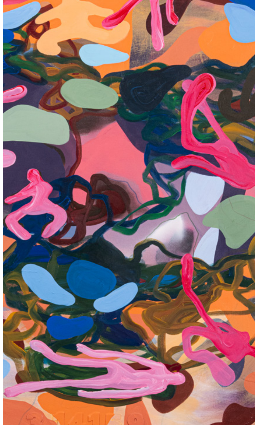
3.14159 or circle Oil, Acrylics and oil pastels on canvas 120 x 100 cm 2023