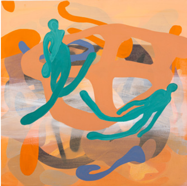
Great Sea of Sand (details) V Oil, Acrylics and oil pastels on canvas 50 x 50 cm 2023