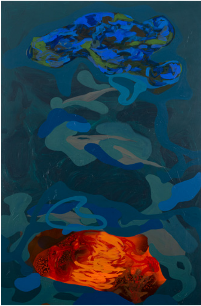
Night View II Oil, Acrylics and oil pastels on canvas 135 x 90 cm 2022-2023