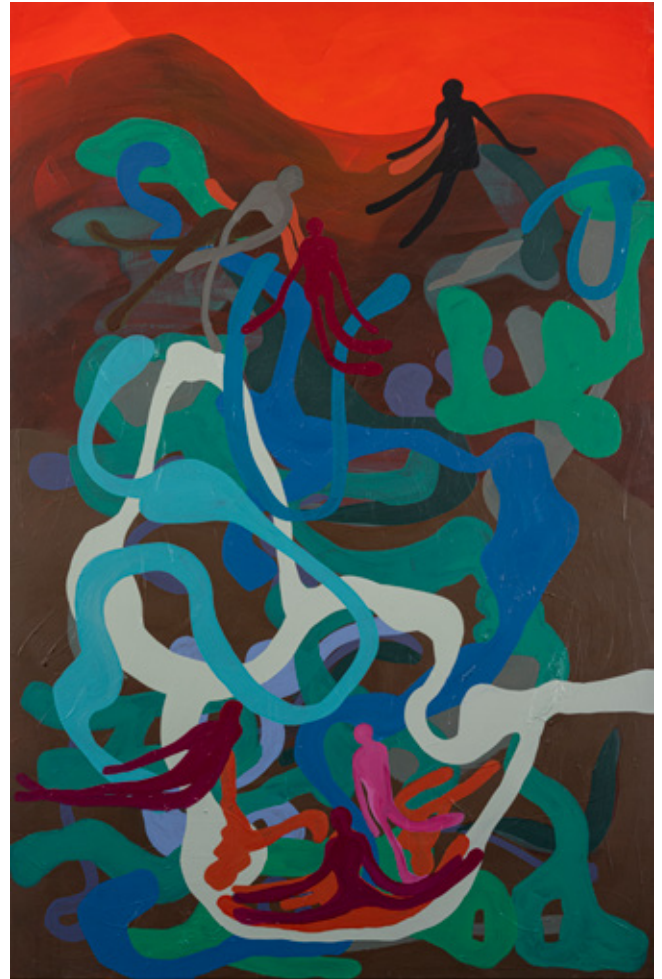
Night View I Oil, Acrylics and oil pastels on canvas 135 x 90 cm 2022-2023