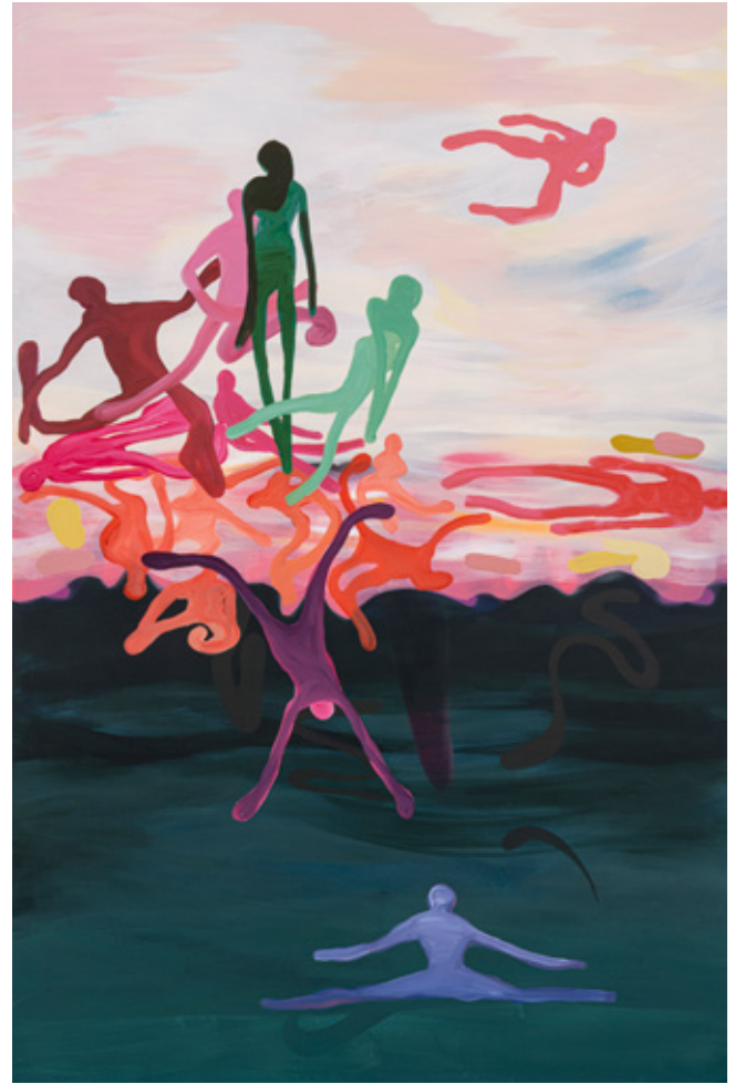
Encounter I Mixed media on Canvas 135 x 90 cm 2023