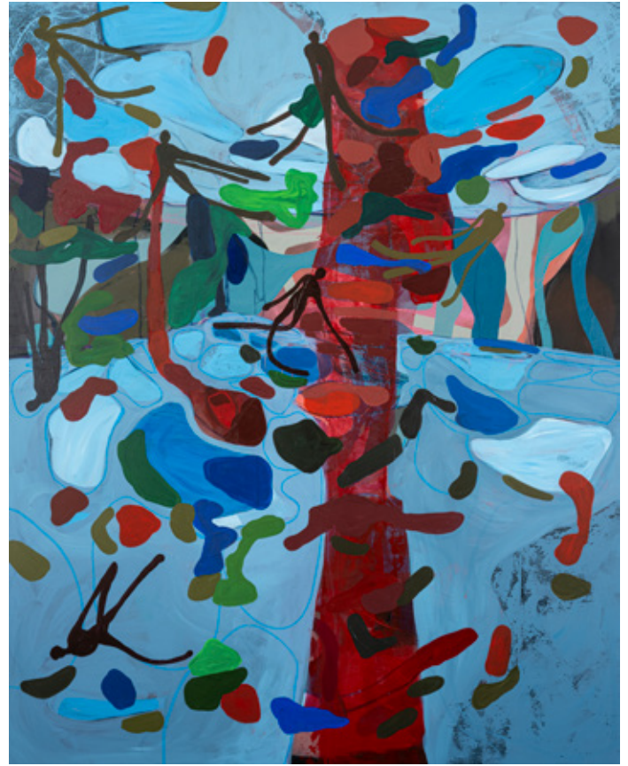
Swimming Pool Oil, Acrylics and oil pastels on canvas 180 x 145 cm 2022-2023